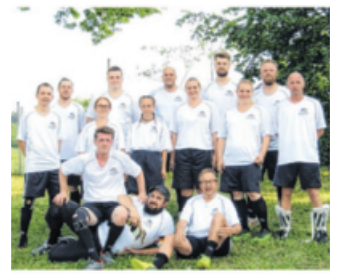
Mit Events wie der Teilnahme am diesjährigen Firmenturnier in Oberrot stärkt der Lindenhof Gesundheit und Teamgeist seiner Mitarbeiter.

Bei Befragungen zeige sich: Die überwiegende Zahl der Teilnehmer bewerte das BGM sehr positiv, berichtet die AOK. Was den direkten Nutzen für die Unternehmen angeht, gibt sich die Krankenkasse zurückhaltend.