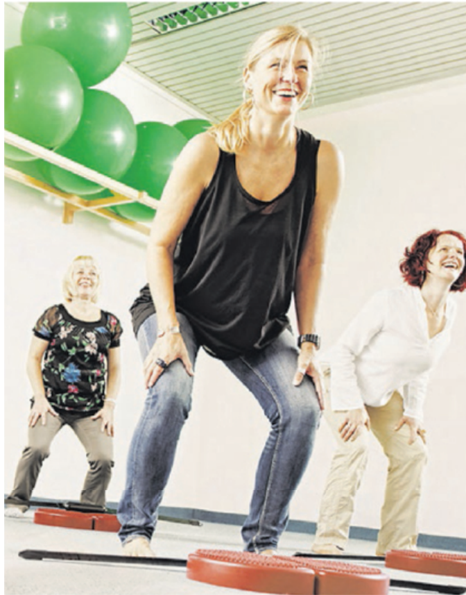
Zum Angebot der Bausparkasse Schwäbisch Hall gehören auch verschiedene Entspannungs- und Fitnesskurse.

Sportliche Aktivitäten, aber auch Ernährungsberatung, Grippeimpfungen und Raucherentwöhnungsprogramme sowie ebenfalls Gesundheitstage bietet